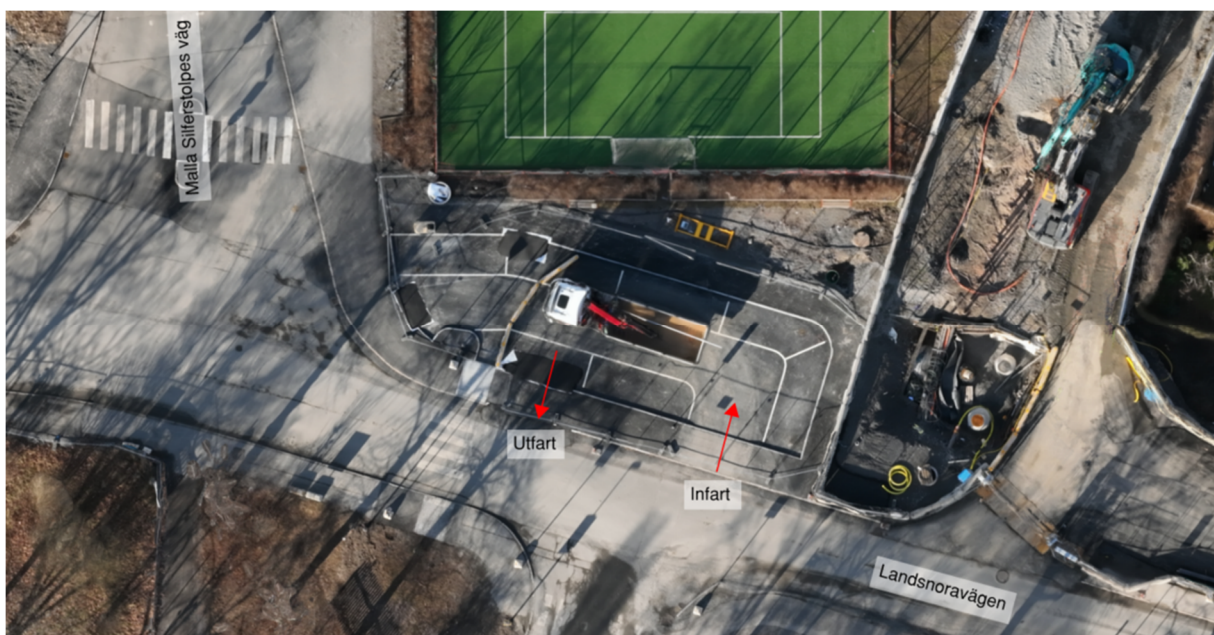
Figur 1, Skiss av den nya avlämningsytan med markering på in- och utfart.

Den tillfälliga avlämningsytan vid Landsnoravägen är öppen och ska prioriteras att användas för att underlätta trafikflödena i området. Barriärerna intill avlämningsytan skyddar gående från fordonstrafik.