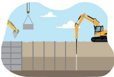
Figur 1, illustrationen visar spontmetoden som används under våren.

Spontarbeten kommer påbörjas i södra området, från Landsnoravägen, och succesivt kommer man arbeta sig norr ut mot skogsdungen. Arbetsmomentet och tider har planerats och följs upp i nära samverkan med skolverksamheterna.