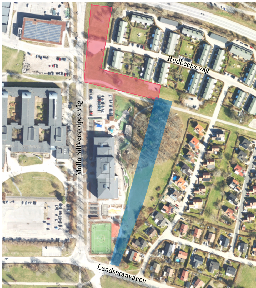
Figur 1, Inom rödmarkerat område kommer markförstärkningsarbeten att pågå med start vecka 7. Inom blåmarkerat område kommer spontningsarbeten att pågå med start vecka 9.